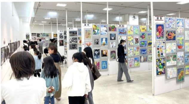
中央展 (FKDインターパーク店 大催事会場)