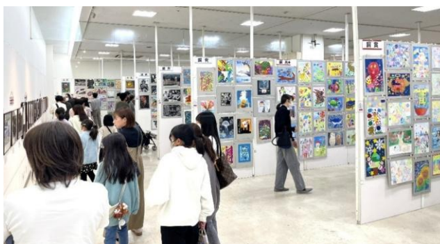
中央展 (FKDインターパーク店 大催事会場)