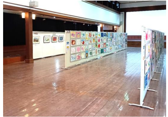
県東展(久保講堂記念館)