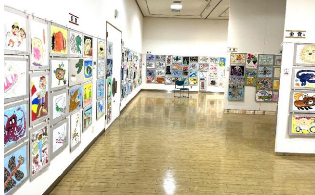
中央展(鹿沼市文化活動交流館)